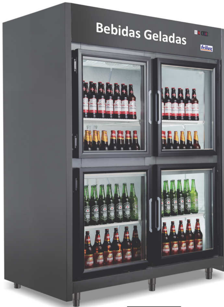
RF-055 Plus PV