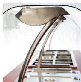
■ Detalhe do suporte