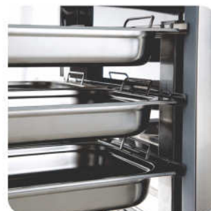
■ Detalhe do Suporte Interno