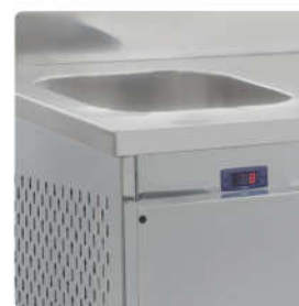
Opcional: Com Cuba