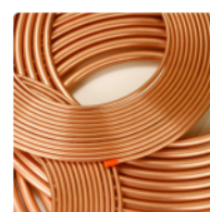
Tubulação de Cobre em toda Linha