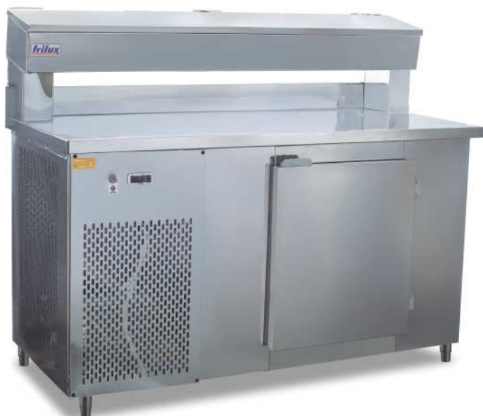
RF-037 - T