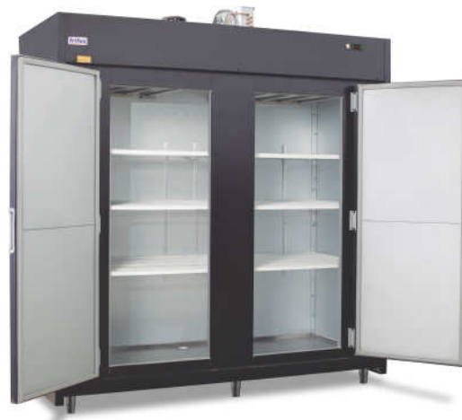
■ Opcional com Prateleiras