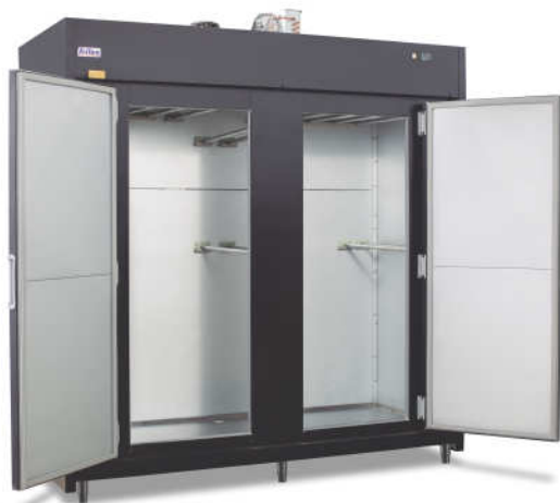
■ Padrão com Gancheiras Duplas