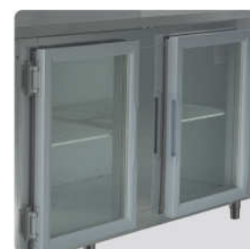
Opcional: Portas de Vidro