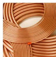
Tubulação de Cobre em toda Linha