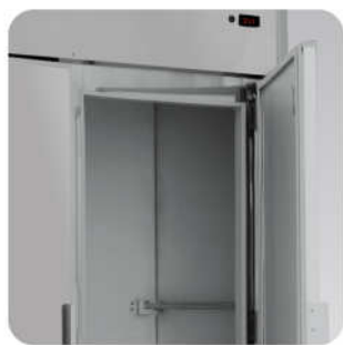
■ Detalhe do Suporte Interno