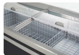
■ Detalhes Internos